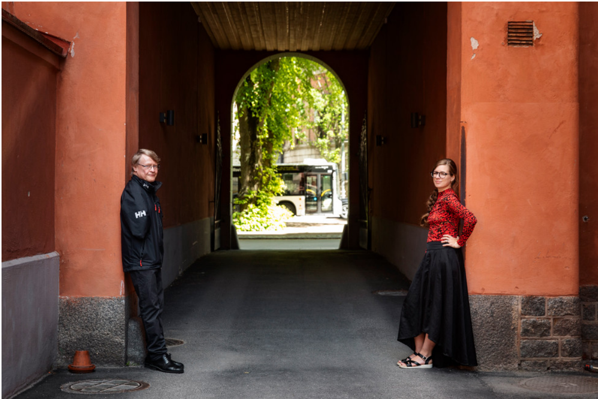
Makarna träffades på en skrivarkurs.

Inför vår intervju har jag varit inne och botaniserat på Storytels erotikavdelning, och subgenrer som ”Erotiska möten”, ”Queerotica”, ”BDSM”, ”Historisk erotik” och ”I uniform”.